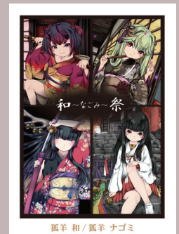
狐羊 和 / 狐羊 ナゴミ